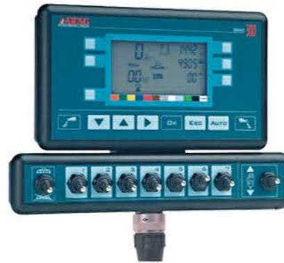
ORDENADOR BRAVO 5 Y 7 VÍAS (Sustitución de mando eléctrico)