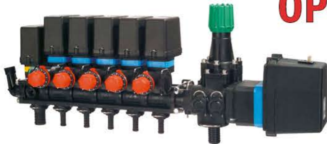
MANDOS ELÉCTRICOS CON 3, 5 Y 7 VÍAS